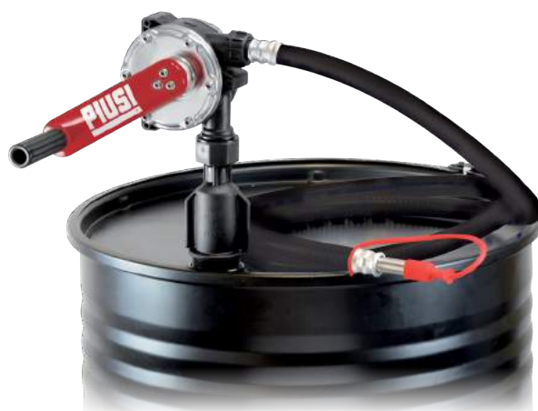
PIUSI HAND PUMP CON MANGUERA Y BOQUILLA DE ACERO INOXIDABLE