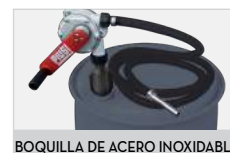
BOQUILLA DE ACERO INOXIDABLE